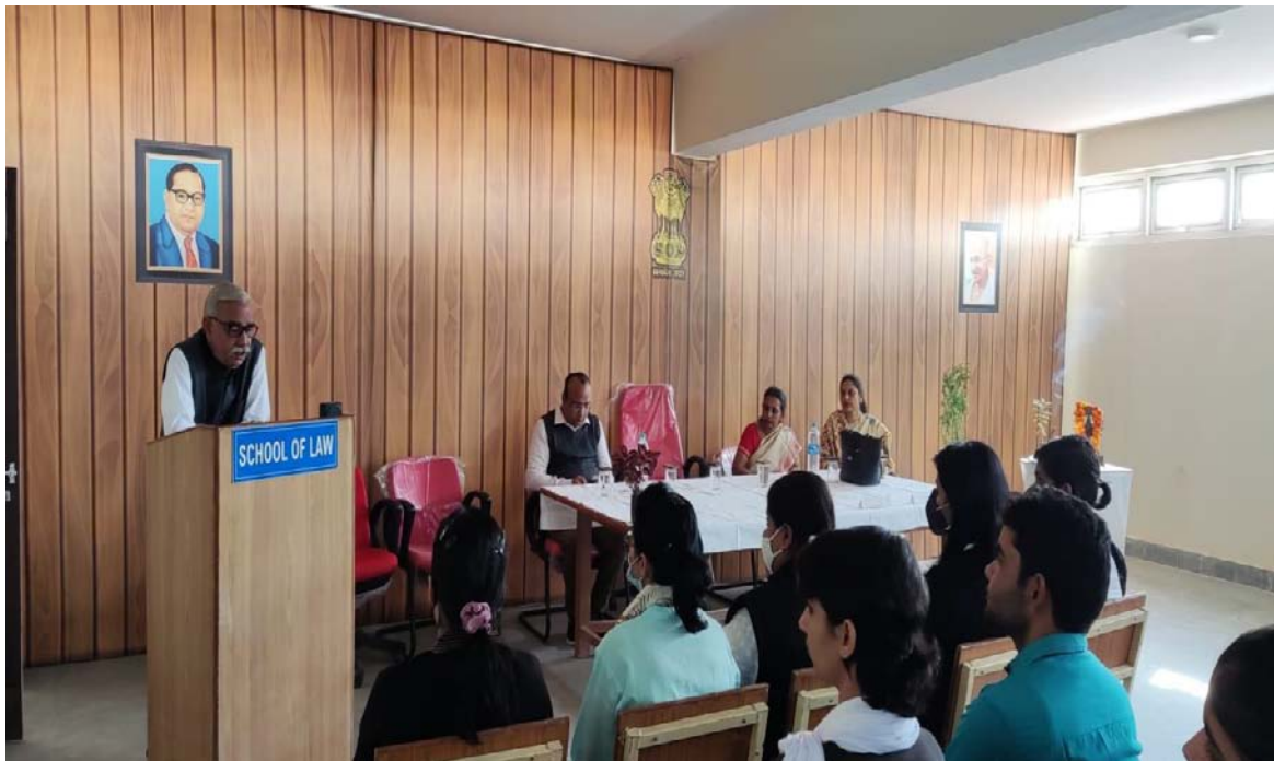
Oath and Pledge undertaken by Students and Staff of the university on occasion of Constitutional Day as Preamble- the soul of constitution _26.11.2021