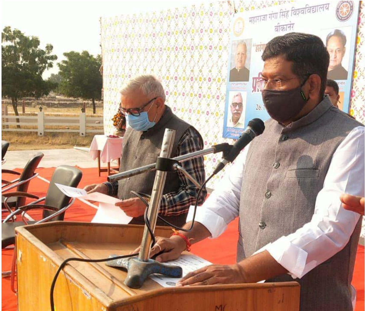
Celebration of Constitutional Day on 26.11.2021 in graceful presence of Hon'ble Minister of Higher Education, Govt. of Rajasthan Sh. Bhanwar Singh Bhati to pledge for abide with our Preamble.